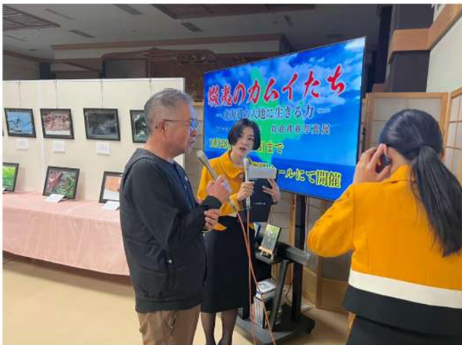
STVラジオ ランラン号生中継取材

ない事も有りますが、出るまで密かに待ち、静寂に包まれ無の心で待つています。 狙っている被写体が現れた時には、一瞬で気持ちを切り替えて、撮影に集中し、良い写真を撮影出来た時の喜びが何とも言えない魅力です。