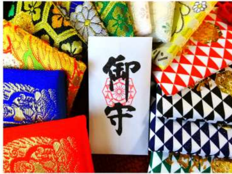
身代守 500円 〃 袋入り 1,000円