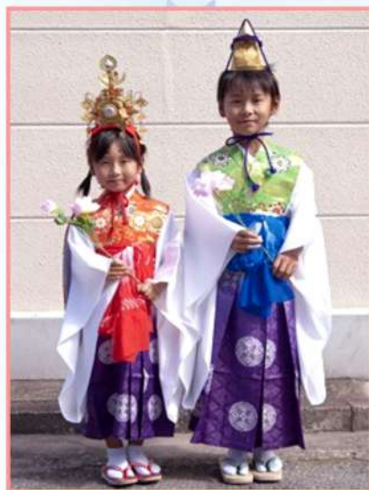
※イメージ写真です

當山開創140周年、慶祝稚児お練り行列参加稚児を募集します。稚児の意味は、仏法の守護神や天人が童子の姿で人間界に現れた「天童」になぞらえています。古来から天童稚児を勤めたお子さまは、元気で健やかに育つといわれております。このおめでたい祝縁に、稚児お練り行列にご参加ください。